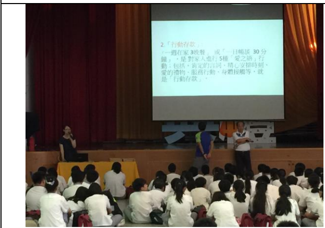
愛的存款簿包括：「學習存款」與「行動存款」兩大項。