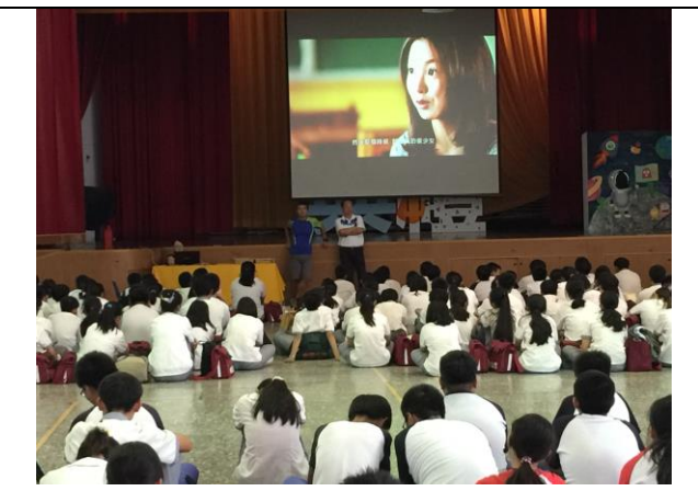
家人間的「愛之語行動，則由互相存款」認證。